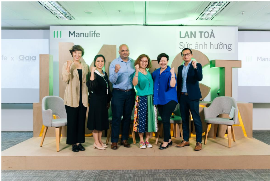
Đội ngũ lãnh đạo cấp cao của Manulife Việt Nam tại sự kiện triển lãm thuộc chương trình 'Lan Tỏa Sức Ảnh Hưởng'

Trải dài một tuần, sự kiện triển lãm thuộc chương trình 'Lan Tỏa Sức Ảnh Hưởng' của Manulife mang đến cho nhân viên cơ hội để đóng góp vào nỗ lực chung của công ty trong việc xây dựng doanh nghiệp tốt hơn, hướng đến một thế giới tốt hơn. Chương trình được thiết kế để giúp Manulife đưa ra các quyết định kinh doanh đúng đắn tại các thị trường đang hoạt động, nhằm thúc đẩy sự đổi mới, cải tiến dịch vụ và sản phẩm cũng như tăng cường đầu tư vào cộng đồng.